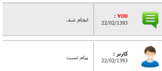
شکل - ج